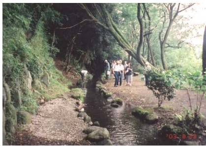
長泉町・富士湧水地

長泉町の湧水は、主に愛鷹山系の湧水です。長泉町で唯一の富士山の湧水と言われる富士山湧水地は、近所の主婦が洗濯物をゆすぎに来ていましたが、せっかくの湧水地なので、もう少し整備してもよさそうに思いました。また、駿河平自然公園で、湧水池に劣環境にも強いというニシキゴイを放してあるのは興ざめでし