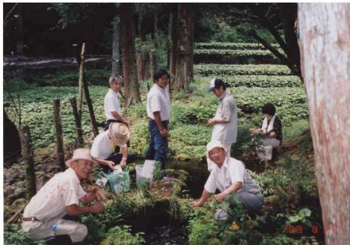
△小山町・須川湧水群湧泉の1つ。周囲にはわさび田が広がっている

△御殿場市・二子湧水。中央の小さな祠を取り囲むように水が流れている。農業用水として利用され、余った水は黄瀬川に惜しげなく流されている